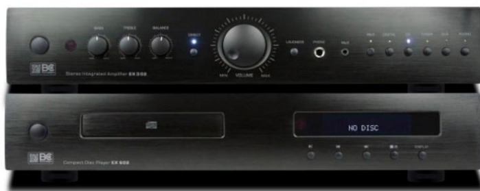
Amplificateur stéréo intégré EX 302

Posted on janvier 20, 2014 by Philippe Adelfang en Banc d'essai, Reportage 1 // 0 Comments